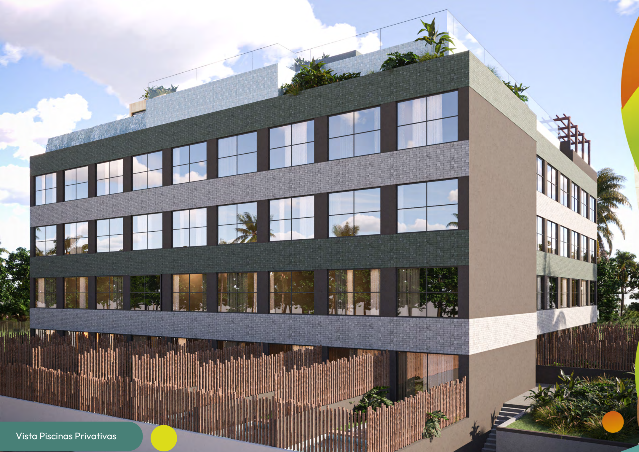
Vista Piscinas Privativas