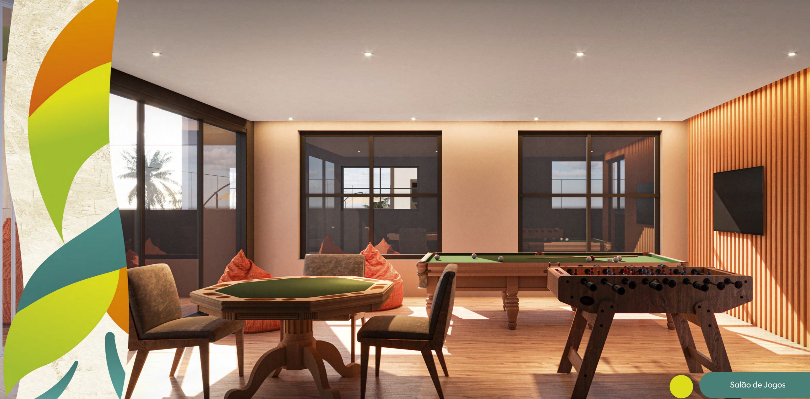
Salão de Jogos

Em atenção às Leis Federais nº 4.591/64 e nº 8.078/90, informamos que todos os objetos de decoração, equipamentos, mobiliário, pisos, rodapés, molduras, forros, sancas de gesso e pontos de iluminação são sugestões de decoração, não fazendo parte do contrato de aquisição. Todas as imagens e perspectivas contidas no material publicitário são meramente ilustrativas, podendo sofrer alterações, inclusive quanto à forma, cor, textura e tamanho. *Para mais informações sobre quais áreas serão entregues mobiliadas, consulte memorial descritivo.